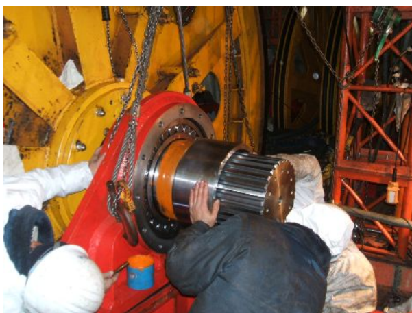
原動滑車軸交換作業