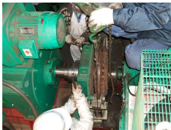
主減速機取り外し作業