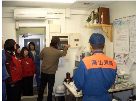
火災時避難誘導訓練