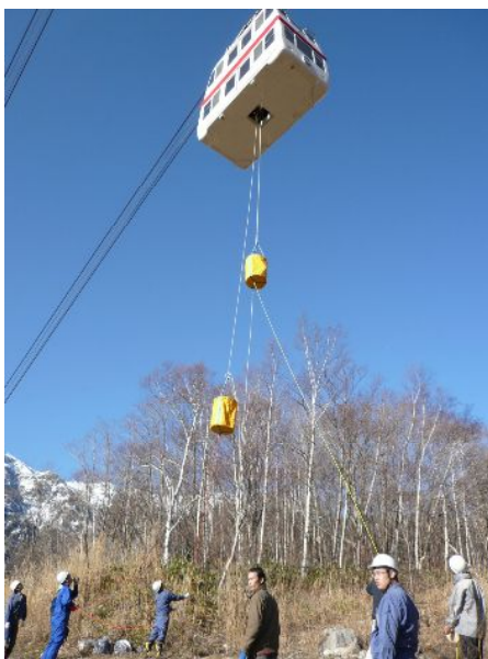
スローダン訓練の様子