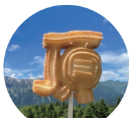
01 CAFÉ GOKAN