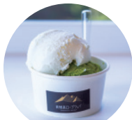
03 TSUMUGI STORE