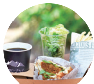
01 CAFÉ GOKAN