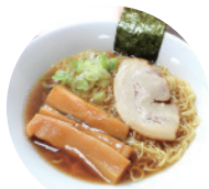
04 咖啡·简餐 笠岳